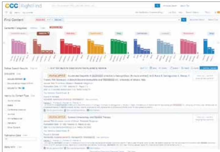
RightFind Insightのセマンティックビジュアライゼーション

SciBiteは、データが発見を促進すると考えており、最新の機械学習とオントロジーアプローチを組み合わせたインフラストラクチャのパイオニアとして、科学的コンテンツの価値を解放しています。